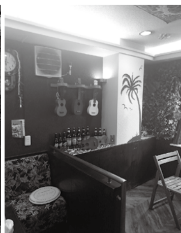
本場ハワイの雰囲気