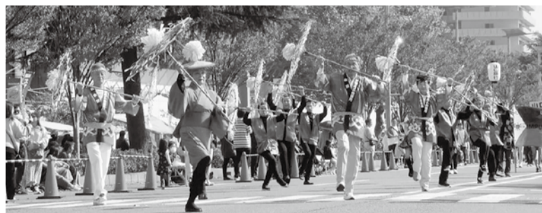
昨年のパレードの様子

当所では、中心市街地の賑わい創出と当所事業のPRなどを目的として、今回は会員企業から約1,000名の事業主・従業員の皆様のご参加を募り「宇部商工会議所・華創パレード」を編成し、宇部市制施行を祝う宇部まつりに参加をいたします。お一人での参加も可能ですので、奮ってのご応募をお待ちしております。