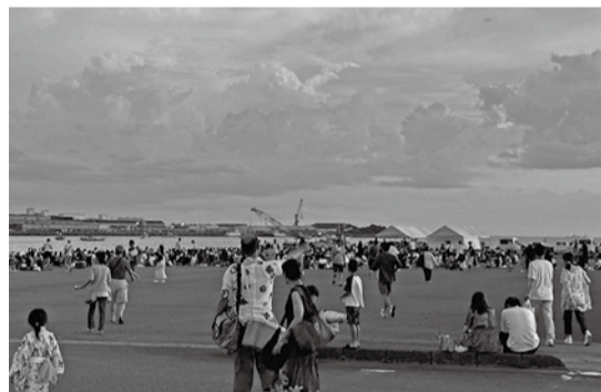
花火打ち上げを待つスポンサーの皆様