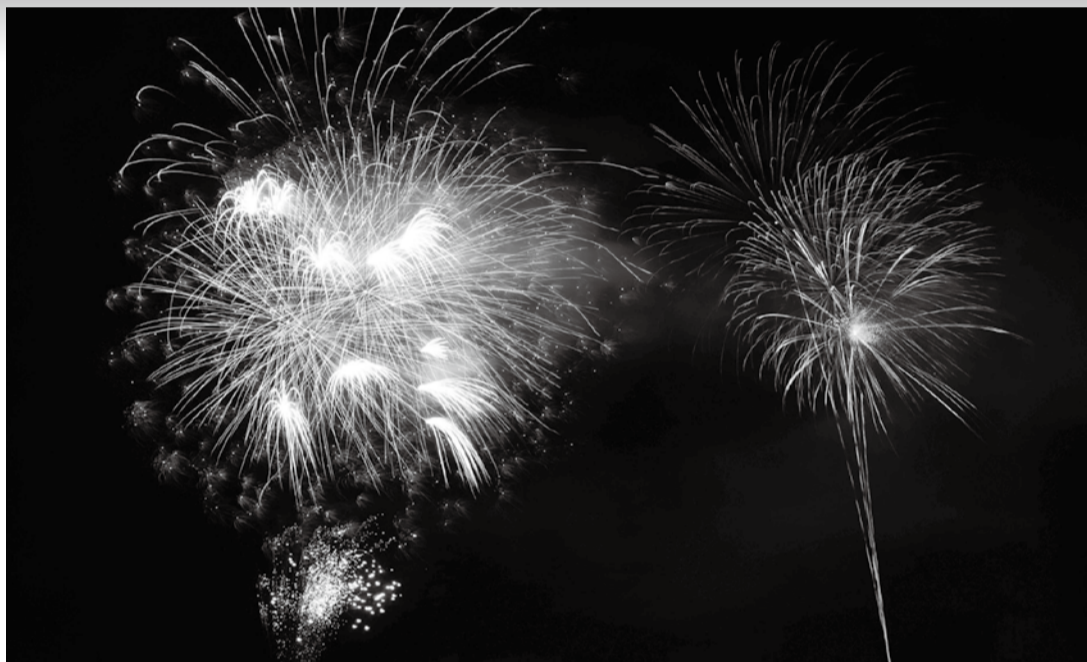
YOASOBIの楽曲に合わせて次々と打ち上がる音楽花火