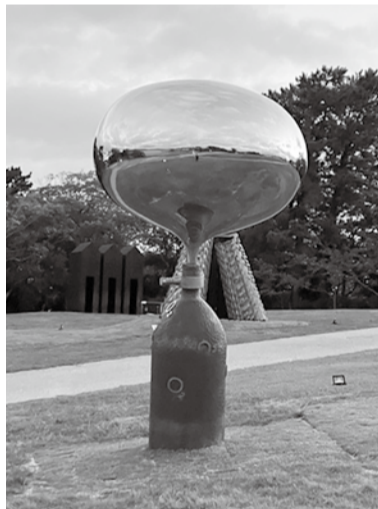
宇部商工会議所賞の「フリーエア」

若手彫刻家の登竜門として宇部市が世界に誇る第30回UBEピエンナーレ(現代日本彫刻展)が、ときわ公園「UBEピエンナーレ彫刻の丘」で10月27日から12月22日まで開催中