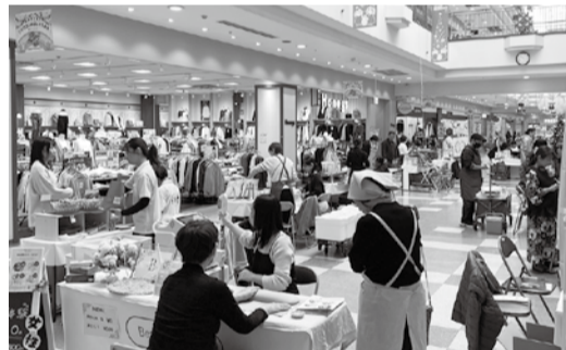
にぎわいを見せる会場