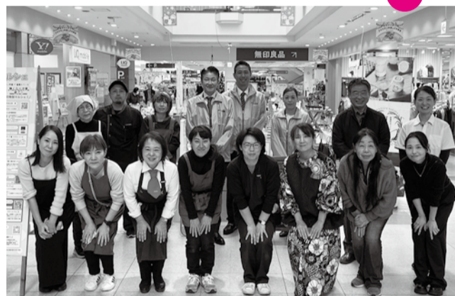
セミナーを受講した出店者のみなさん

会場にはSNSで開催を知ったお客様がマルシェ開催直後に来店されるなど、にぎわいをみせ、午前中で完売となってしまった店舗も見受けられた。