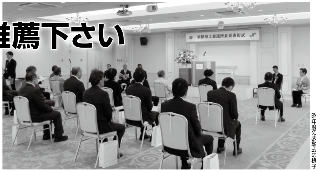
昨年度の表彰式の様子