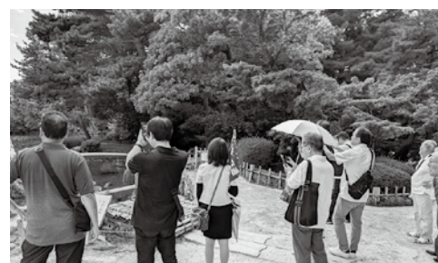
兼六園の歴史について説明を受ける参加者の皆さん

訪れた。永平寺はインバウンドの影響も少なく、厳かな雰囲気の内を落ち着いて散策することができた。