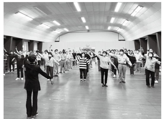
写真は昨年の参加各社リーダー練習会の様子